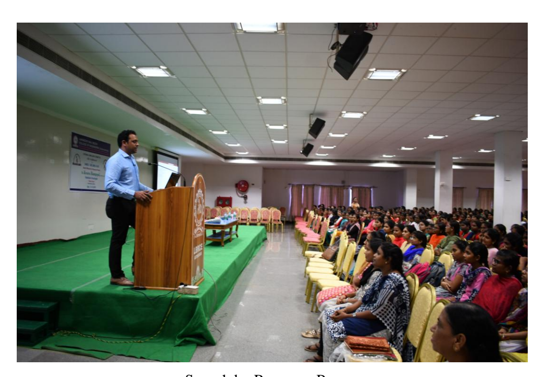
Speech by Resource Person