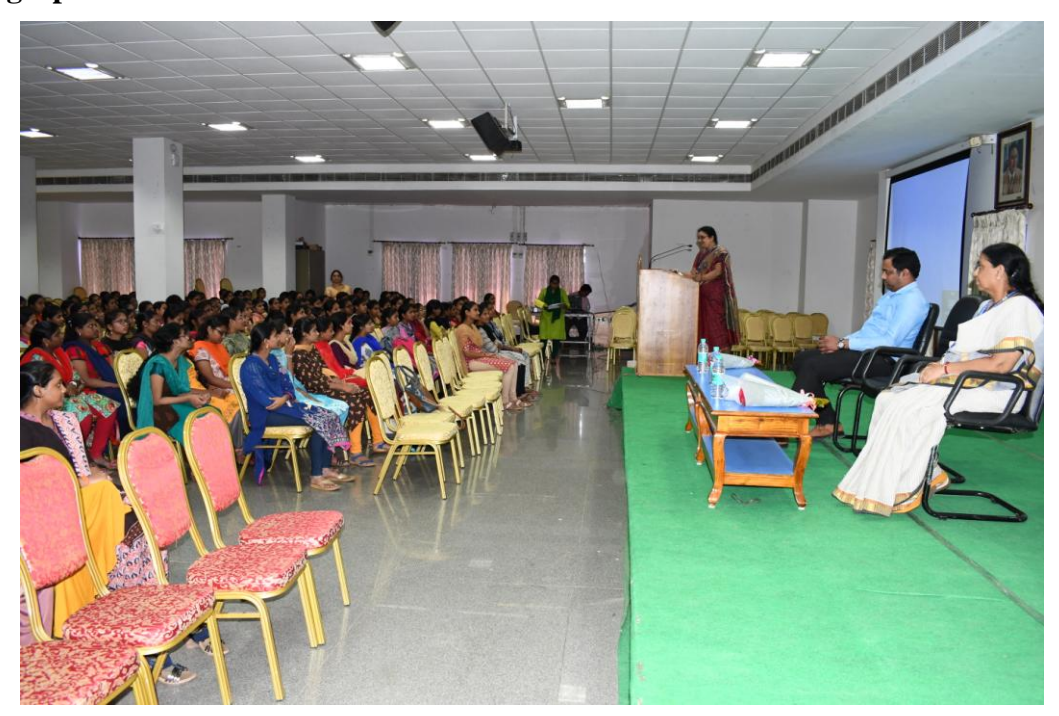
Welcome speech by Presiding Officer